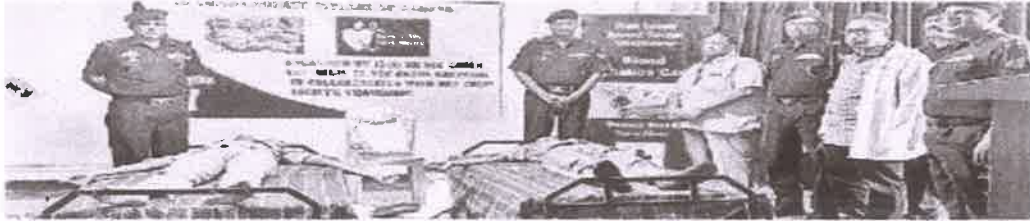
రక్తదానం చేస్తున్న ఎన్సీసీ విద్యార్థులు