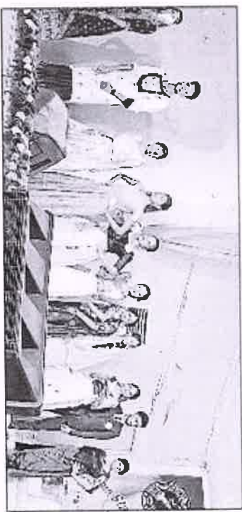
ఫ్యాషన్ షోలో నర్సింగ్ విద్యార్థులు

గన్నవరం రూరల్: ఆరోగ్య సమాజ నిర్మాణంలో నర్సుల పాత్ర కీలకమని పలువురు వక్తలు పేర్కొన్నారు. చినఅవుటపల్లి డాక్టర్ పిన్నమనేని సిద్ధార్థ మెడికల్ కళాశాల ఆవరణలో ది ట్రైన్ నర్స్స్ అసోసియేషన్ ఆఫ్ ఇండియా వీవీ బ్రాంచ్, న్యూడెంట్ నర్స్స్ అసోసియేషన్ ఆధ్వర్యంలో నిర్వహించిన రెండు రోజుల సదస్సు శనివారం ముగిసింది. ఈ సందర్భంగా విద్యార్థులకు నిర్వహించిన వ్యాసరచన, క్రీడలు, పెయింటింగ్, డ్యాన్స్ పోటీలు, ఫ్యాషన్ షో విజేతలకు బహుమతులు అందజేశారు. రాష్ట్రంలోని 80 నర్సింగ్ కాలేజీలు, నర్సింగ్ స్కూళ్ల నుంచి రెండు వేల మంది విద్యార్థులు, 150 మంది టీఎన్ఎ మెంబర్లు పాల్గొన్నారు. 30వ రాష్ట్ర సదస్సును ఘనంగా నిర్వహించి నర్సింగ్ విద్యార్థుల సాధికారత, అవకాశాలు, సవాళ్లు అంశంపై చర్చిం