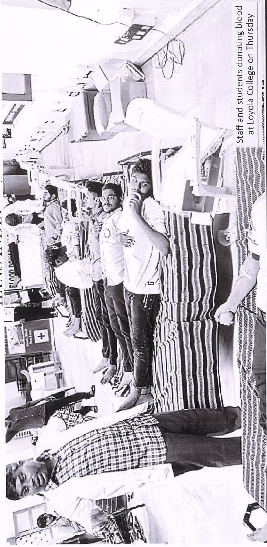
Staff and students donating blood at Loyola College on Thursday