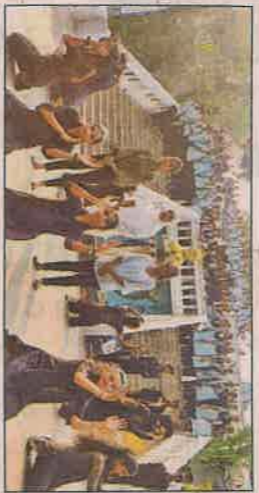
కరెన్సి, సగర్, స్టూడెంట్లు: విద్యార్థుల శ్రేణి ప్రదర్శన