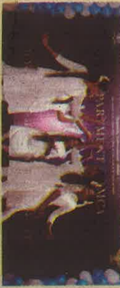
స్టూడెంట్ల అలంకరణ ఎంసీఏ విద్యార్థులు