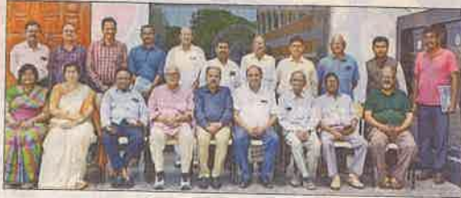
సమావేశానికి హాజరైన అధ్యాపకులు

కరెన్సివగర్, న్యూస్టుడే: ప్రాచీన చరిత్రను కాపాడేందుకు ఆచార్యులంతా సమాయత్తం కావాలని ఆంధ్రప్రదేశ్ హిస్టరీ కాంగ్రెస్ పిలుపునిచ్చింది. ఏపీ హిస్టరీ కాంగ్రెస్ కార్యవర్గ నిర్వాహక కమిటీ సమావేశం ఆదివారం విజయవాడలోని ఆంధ్రాలయాల కళాశాల ఎస్జే బ్లాకులో